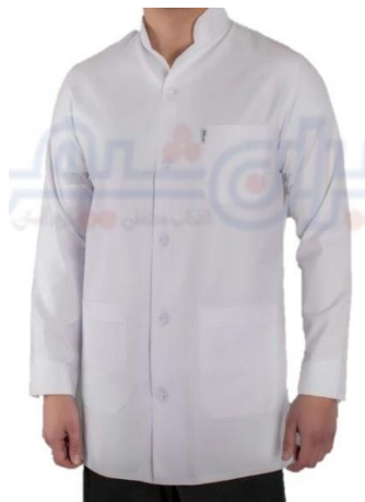
عکس شماره ۵