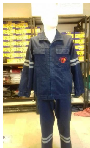
عکس شماره ۱