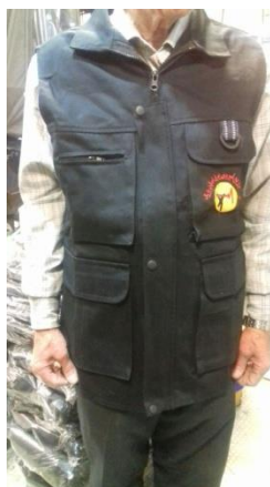
عکس شماره ۳