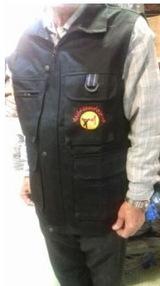
عکس شماره ۴